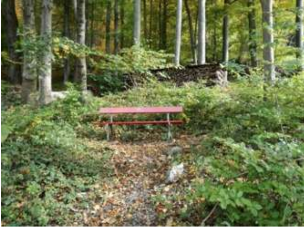
Ruhebänkli in Ennenda