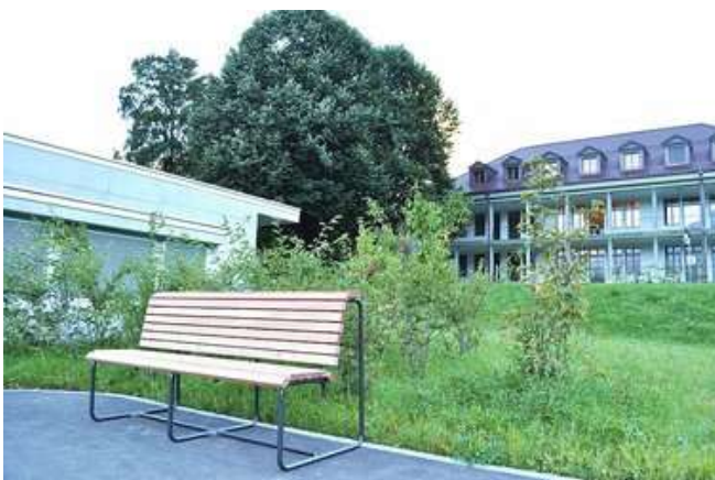
Glarnerbänkli beim Kantonsspital Glarus