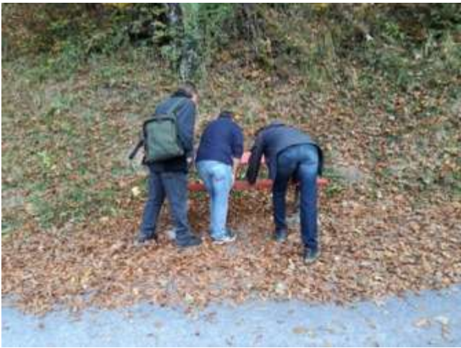
Banklikontrolle in Ennenda, www.verkehrsverein-ennenda.ch