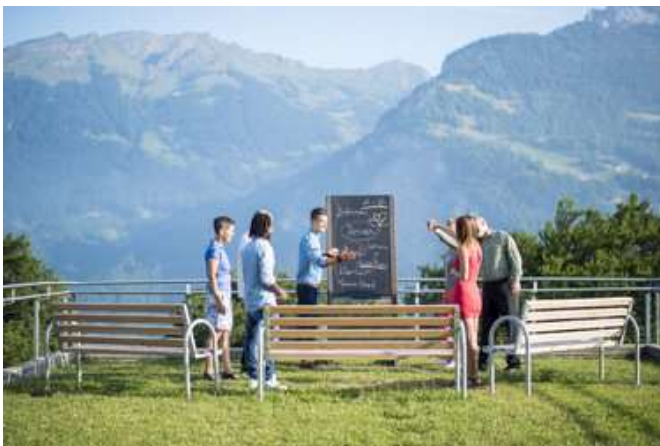
DenkOrt Reutegg in Filzbach, www.glarusnord-tourismus.ch