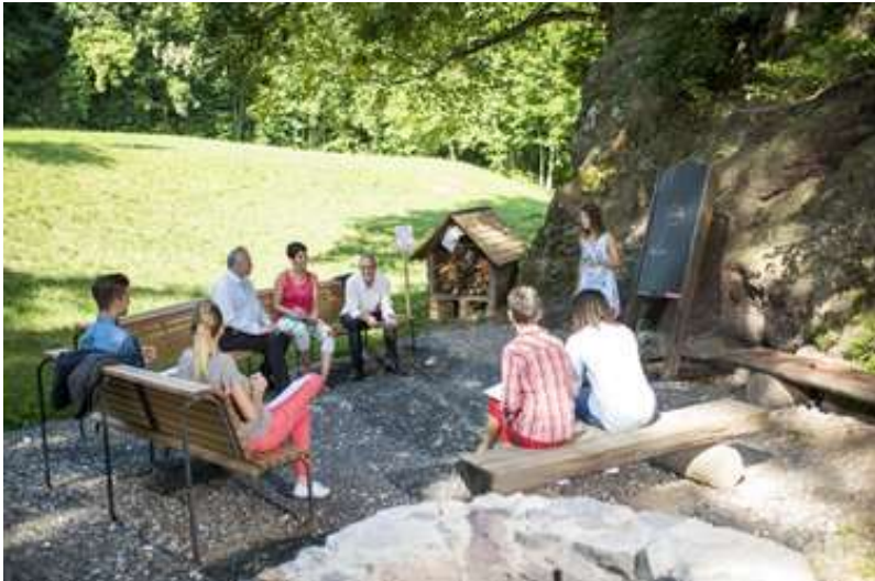
DenkOrt beim Waldplatz Oerli in Filzbach, www.glarusnord-tourismus.ch